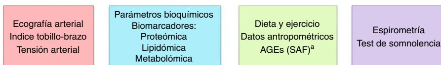
Figura 2 - Pruebas diagnósticas en la unidad móvil.

a La prueba diagnóstica utilizada para medir los AGE es la autofluorescencia de la piel.