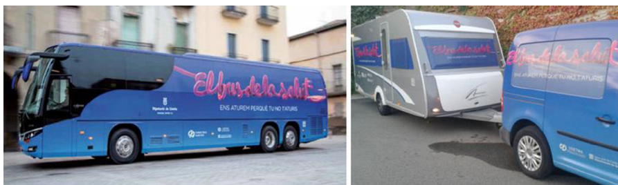
Figura 1 - Diseño exterior de la unidad móvil (autobús y caravana).