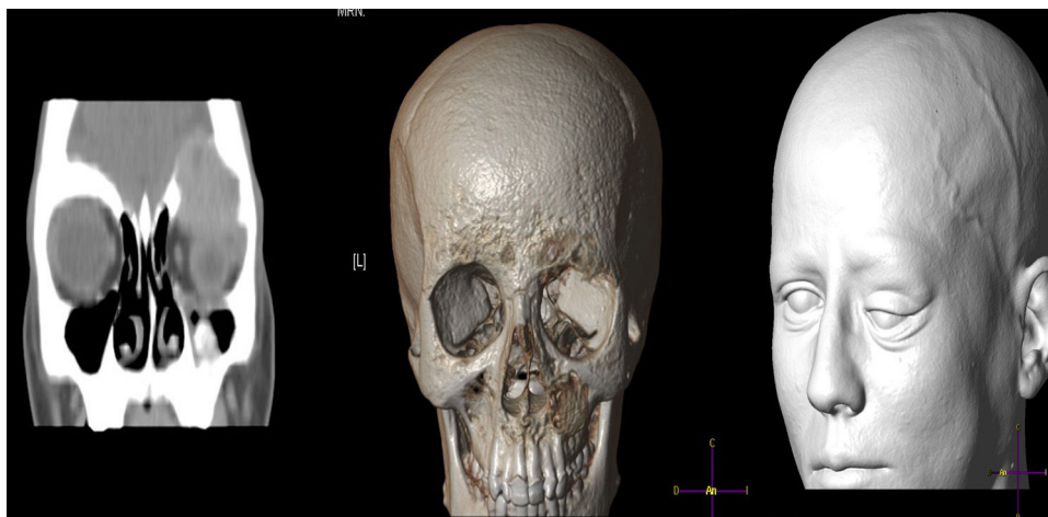
Figura 1 – TAC craneal y orbitario con reconstrucción precirugía.

preferentemente a costillas, clavículas, mandíbula y pelvis 3 , con infrecuente afectación orbitaria 2 .