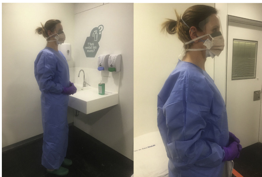
Figura 2 – Equipo protector individual (EPI) para coronavirus. Consta de un par de guantes de nitrilo de manga larga sin polvo, bata larga impermeable, máscara FFP2 y máscara quirúrgica con pantalla completa. Esta lista de equipos de protección individuales se encuentra en revisión permanente dependiendo de la evolución y la nueva información disponible de la enfermedad de SARS-CoV-2.