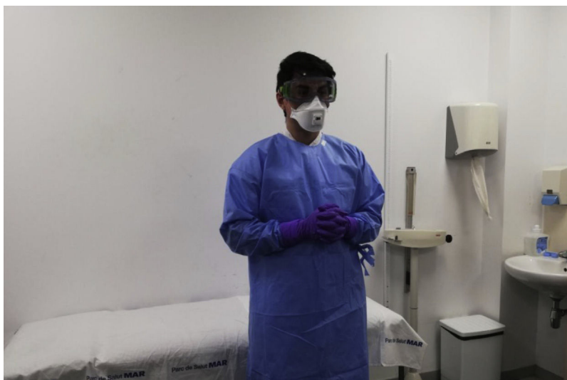
Figura 3 – Solo en caso de que se vayan a producir aerosoles (administración de nebulizaciones, ventilación mecánica, fibrobroncoscopia, intubación orotraqueal, aspiración de secreciones, etc.) se requiere máscara FFP3 (con válvula de exhalación) y gafas de protección completa. Se recomienda que todo el material sea desechable. Si no se dispone de manga larga, utilizar la bata de aislamiento (verde) y añadir un delantal de plástico.

desconecta, ayuda al paciente a entrar y salir de la habitación y limpiar la habitación. La misma bata de aislamiento no debe usarse para el cuidado de más de un paciente, excepto si están aislados juntos (aislamiento de cohortes).