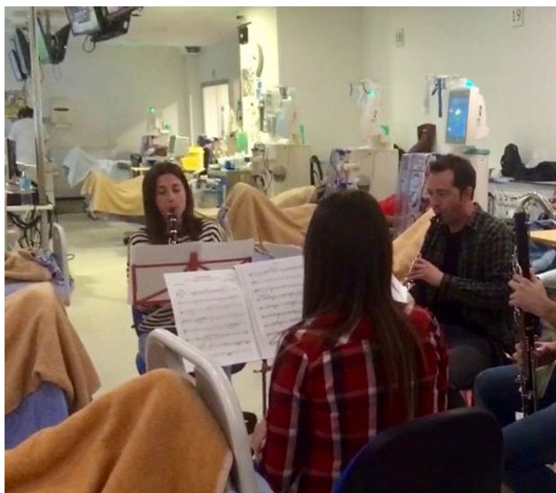
Figura 1 – Imágenes de las actuaciones.

acuerdo a la Ley de Protección de datos 3/2018 de 5 de diciembre, en el ámbito de la investigación biomédica, la protección de datos de carácter personal y la bioética.