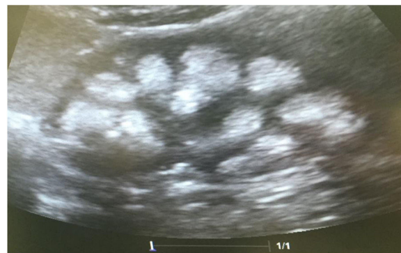
Figura 2 – Ultrasonido renal del caso 1, con imágenes hiperecogénicas distribuidas en forma difusa en la región medular, que adopta la forma de las pirámides, sin proyectar una sombra acústica posterior. Compatible con una nefrocalcinosis severa bilateral.

100/60 mmHg. Los niveles de creatinina eran 0,78 mg/dl (CCR 122 ml/min), el sodio 139 mEq/l, el potasio 3,3 mEq/l y la cloremia 113 mEq/l. En la gasometría venosa se comprobó una acidosis metabólica (pH 7,17, \text{HCO}_3^- 14,1 mEq/l) con hipocitraturia (14 mg/24 h) y proteinuria 382 mg/24 h (tabla 2). El pH urinario era 7 y el hiato aniónico (anión gap) urinario positivo (+36). En el ultrasonido renal se observó nefrocalcinosis medular grado II-III (fig. 3). Se comprobó la existencia de un cálculo en el tercio inferior ureteral derecho y otro de 1,5 cm en la vejiga. Se realizó el estudio genético analizando los genes ATP6V0A4 , ATP6V1B1 y SLC4A1 . Se comprobó la presencia de una variante patogénica en heterocigosis en el exón 20 del gen SLC4A1 , c.2710.*12, p. (Tyr904.Val911delins68) que se traduce en una delección de 39 bases (27 del último exón y 12 de la región 3' UTR) que modifica la parte carboxi terminal de la proteína (delección de los últimos 8 aminoácidos e inserción de una nueva secuencia de 68 aminoácidos). Esta variación no descrita en la literatura y no incluida en la base de datos, es considerada patogénica, de acuerdo a la ACMG 2015, clase 5 (American College of Medical Genetics and Genomics); los criterios usados para clasificarla en clase 5 son: PVS1, PM2, PM1, PM4. Esta variación no está presente en la base de datos de población general gnomAD (criterio PM2)