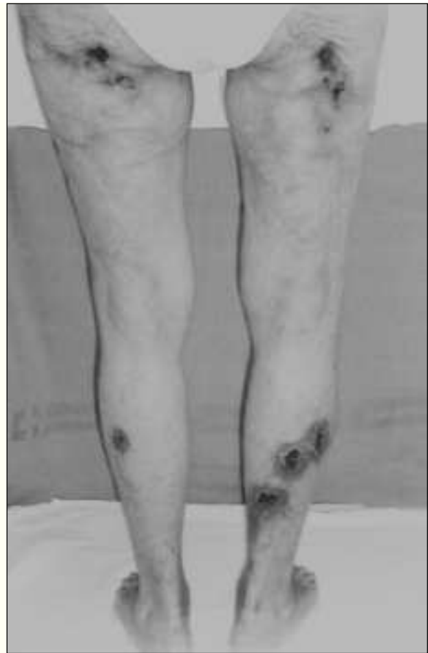
Fig. 3.—Aspecto macroscópico de las lesiones cutáneas de la calcifilaxis, afectando extremidades inferiores.

Otro de los factores de riesgo implicados es la obesidad 9 . Bleyer y cols. 6 en un estudio donde se revisan nueve pacientes con calcifilaxis proximal, identifican como factor de riesgo un elevado índice de masa corporal (35 kg/m 2 ). La razón por la cual