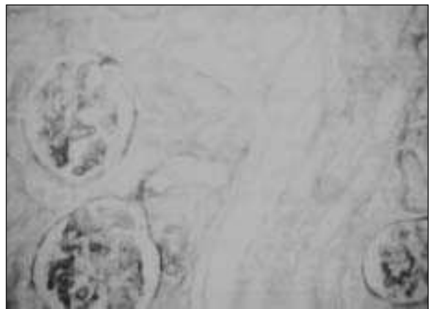
Fig. 3.— Lesión glomerular y vascular con necrosis cortical renal bilateral en un paciente con sepsis.