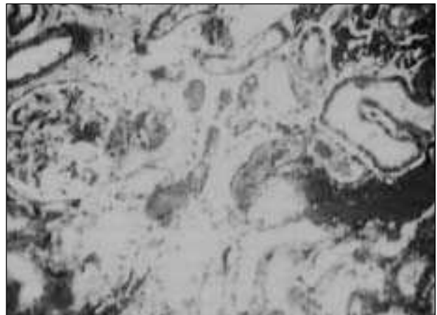
Fig. 2.—Microfotografía que muestra lesión glomerular con microtrombos en su luz, necrosis tubulointersticial y hemoglobina en la luz de los túbulos.