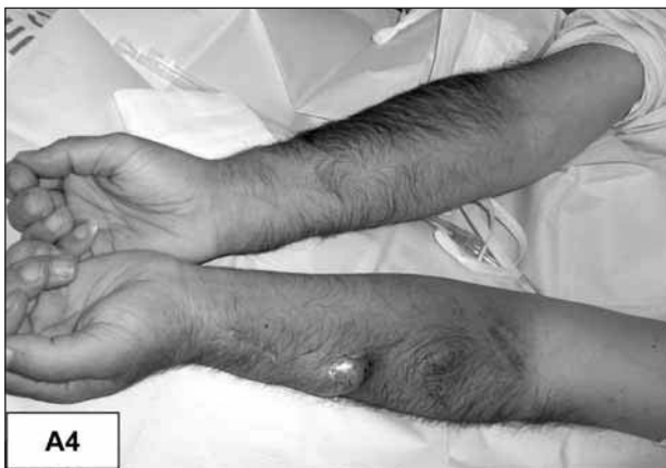
Fig. A4.—Disminución del edema masivo tras tratamiento.

concluyentes ni amplios que comparen ambas alternativas. Pese a que Quin y cols. 10 no encontraron diferencias entre la implantación de stent con angioplastia o angioplastia aislada, en la mayoría de los trabajos se refiere un mejor resultado con la asociación de stent intraluminal 1,2,7,11 . La evolución a medio plazo muestra datos dispares. La tasa de reestenosis al año oscila entre un 10 y un 43% según