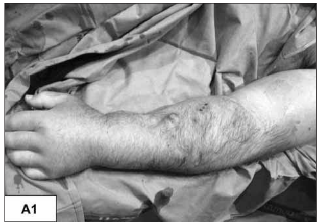
Fig. A1.—Edema masivo de miembro superior izquierdo.

La aparición de estenosis en las venas centrales (subclavia o braquiocéfálica) sin punción previa, ni implantación de catéter o marcapasos, es un acontecimiento excepcional, aunque se ha descrito en enfermos tratados con hemodiálisis 1 . El hiperflujo