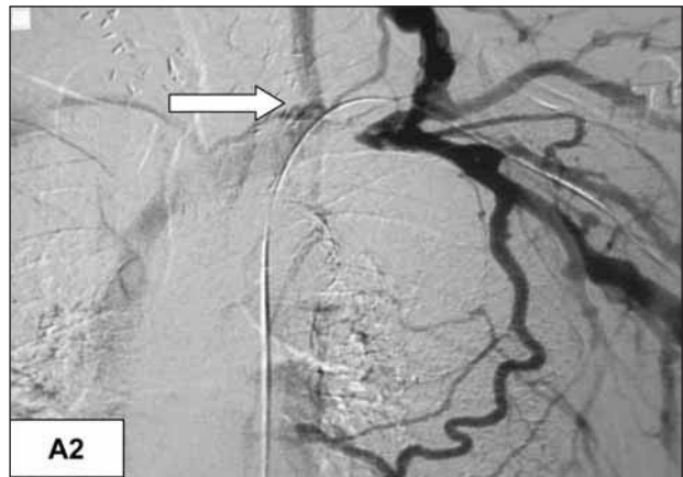
Fig. A2.—Estenosis corta de vena subclavia izquierda.

de sangre y las turbulencias ocasionadas por la existencia de la fístula arteriovenosa pueden provocar alteraciones en la pared venosa que evolucionen hacia una retracción de la misma con estenosis de la luz 4 .