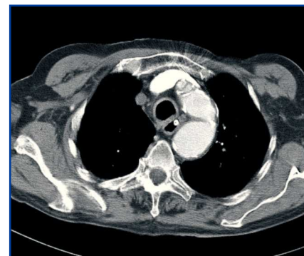
Figura 2. TAC torácica.