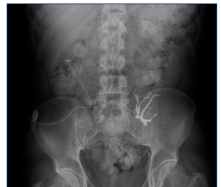
Figura 1. Radiografía simple de abdomen.

hemodiálisis en 2010. Por intolerancia al segundo injerto, fue sometido a embolización de éste. Debido a un hiperparatiroidismo secundario e hiperfosforemia, estaba siendo tratado con carbonato de lantano, 750 mg cada 8 horas. Por fracaso de varios accesos vasculares, se propuso al paciente ser transferido a diálisis peritoneal y se implantó un catéter de Tenckhoff recto de doble cuff . Durante el entrenamiento se objetivó malfunción del catéter, con drenajes incompletos, por lo que se realizó radiografía de abdomen, (figura 1) y peritoneografía (figura 2). Éstas mostraron, además de los restos de material radiopaco de la embolización del injerto, gran cantidad de material fecal en todo el marco de intestino grueso conteniendo imágenes radiolucientes de restos de carbonato de lantano. El catéter peritoneal aparecía mal posicionado hacia el ángulo hepático del colon, y el contraste de la peritoneografía quedaba totalmente encapsulado entre el colon trasverso y el borde inferior hepático que queda claramente dibujado, sin difundir al resto de la cavidad abdominal. La suspensión del lantano y un tratamiento laxante intenso resolvieron progresivamente el estreñimiento y la encapsulación del contraste, no así la mala posición del catéter, que hubo de ser recolocado posteriormente.