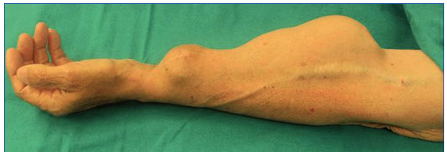
Figura 1. Exploración física Aspecto clínico de la tumoración.

El tratamiento de los aneurismas arteriales verdaderos debe realizarse de forma preferente por el riesgo de complicaciones locales y sistémicas que conllevan, pueden embolizar, trombosarse, erosionar la piel y causar infección, sangrado, o comprimir estructuras nerviosas adyacentes produciendo parestesia, dolor o alteraciones de la movilidad 6 . El tratamiento de elección es la resección del aneurisma con reconstrucción arterial 4 para garantizar una perfusión adecuada de la extremidad después