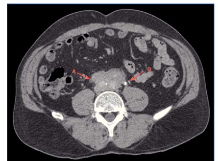
Figura 2. Tomografía computarizada. Tomografía computarizada que muestra masa retroperitoneal englobando uréter derecho (A). El uréter izquierdo se encuentra libre, pero cerca del límite de la masa retroperitoneal (B).

En el caso que hemos expuesto, el paciente presenta importante deterioro de función renal que es secundario a UPO bilateral (derecha establecida e