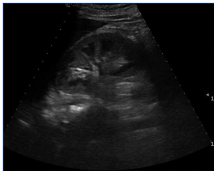
Figura 2. Riñón derecho. Ecografía renal al ingreso.

Presentamos nuestra experiencia clínica de hemoglobinuria secundaria a percusión de forma excesiva de tambores africanos dyembe . Descartamos la causa de orina rojo-marrónácea como hematuria, porque el sedimento de orina es negativo a eritrocitos; a pesar de tener tira reactiva fuertemente positiva para sangre, ya que la tira reactiva utilizada testa la concentración del pigmento hemo, que se encuentra en los eritrocitos, la mioglobina y la hemoglobina por su actividad pseudoperoxidasa para catalizar una reacción entre peróxido de hidrógeno y el cromógeno tetrametilbencidina, produciendo un producto oxidado de color azul oscuro 9 . La combinación de tránsito prolongado a través de la nefrona y un pH ácido de la orina resulta en formación de metahemoglobina, de un rojo-chocolate o «color Coca-Cola» 10 . En el fracaso renal agudo por mioglobina, rhabdomiólisis, son necesarios valores de CPK de en torno a 1500-100 000 UI/l 11 ; nuestro paciente presentó 255 UI/l.