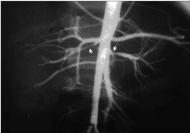
Fig. 2.—Arteriografía del caso 3 en la que se observa estenosis de ARI y estenosis larga de la arteria la renal superior derecha.

isotópico con captopril era patológico (fig. 3) y el basal normal. A los tres años de edad se realizó autotrasplante de RI y actualmente está bien controlada con IECAs y tiene una importante mejoría de la miocardiopatía.