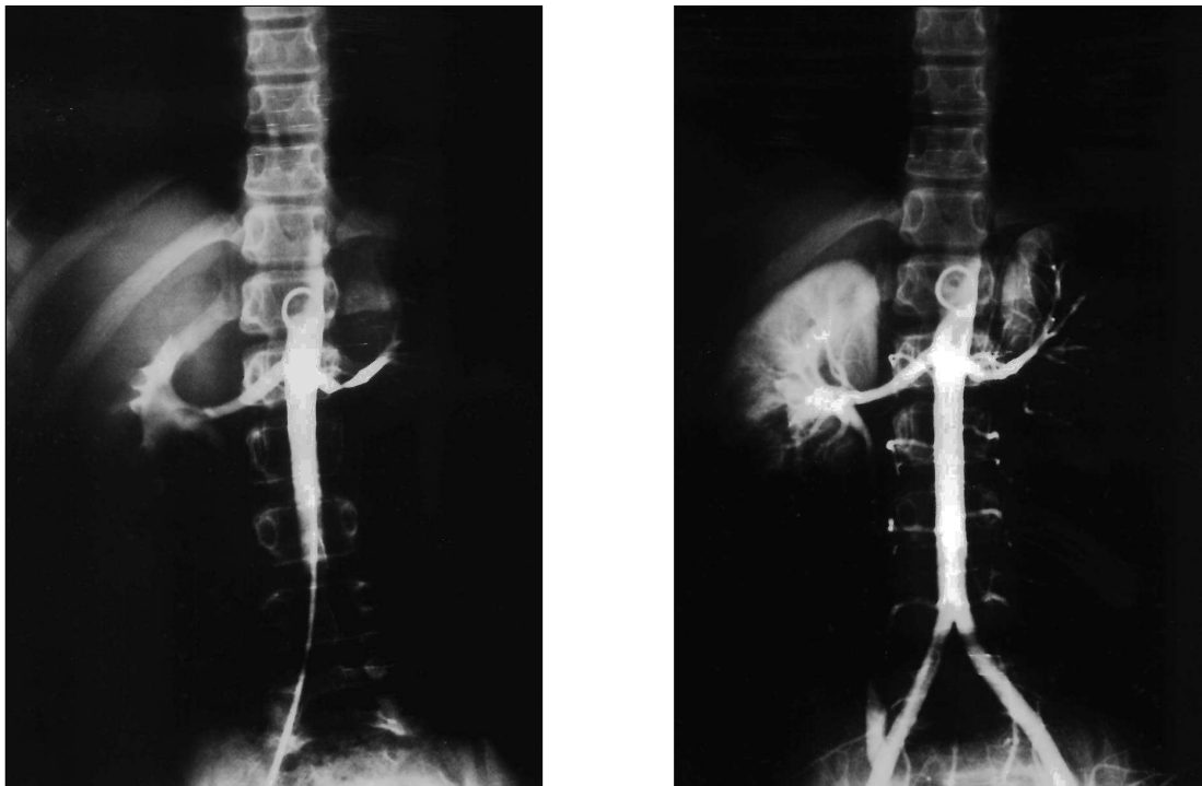
Fig. 1.—Arteria renal izquierda del caso 1, pre (a) y post (b) ATP.

Miocard.: Miocardiopatía. R.I.: Riñón izquierdo. TA n.: Tensión arterial normal.