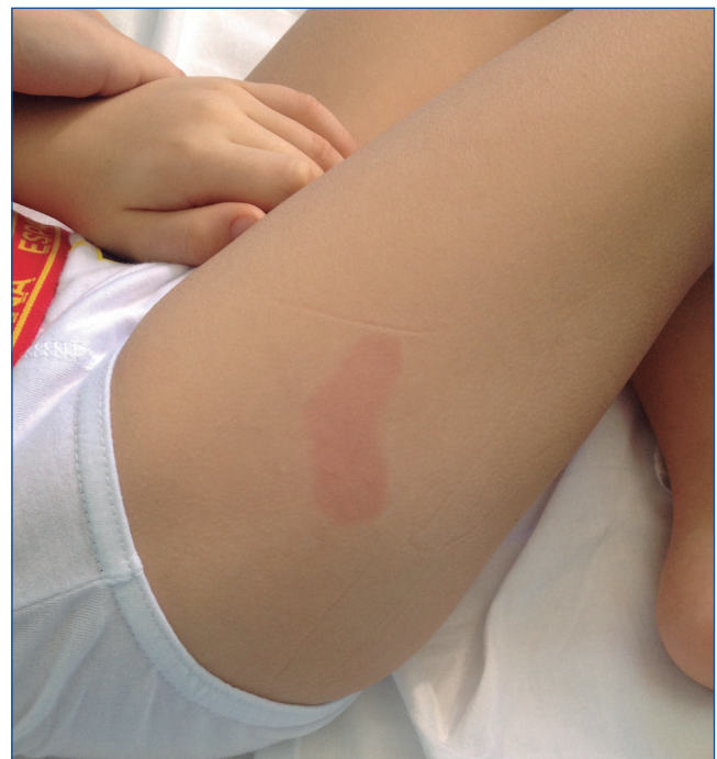
Figura 1. Lesiones maculares que aparecieron en la evolución.

A pesar de ello, la sintomatología del niño persiste, con picos de fiebre de 40° axilar, difícil de controlar con antitérmicos, escalofríos, anemia y plaquetopenia marcadas (requirió 2 transfusiones de concentrado de hematíes y 4 de plaquetas), y, en ocasiones, aparición de máculas hiperémicas (fig. 1) relacionadas con el pico febril, que desaparecían al descender la temperatura. En un nuevo estudio de médula ósea se positiviza la PCR a leishmanias, y también lo hizo en sangre; BAAR (bacilos ácido alcohol resistentes), negativos.