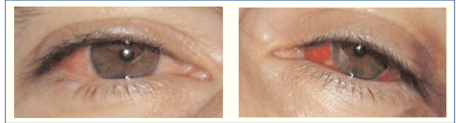
Figure 1. Subconjunctival bleeding due to diffuse episcleritis.

Here we present a case of a 44 year old male patient complained of asthenia for one month. Two weeks before he developed bilateral subconjunctival hemorrhage without photophobia or ocular pain. The patient denied epistaxis, hemoptysis, abdominal pain, arthralgias or myalgias. On examination he had subconjunctival bleeding due to bilateral diffuse episcleritis (Figure 1). There were no cardiopulmonary auscultatory findings, no purpura and no signs of arthritis. The patient past medical history was remarkable for chronic sinusitis with frequent episodes of epistaxis. The blood panel showed severe azotemia (serum creatinine 11,2 mg/dl, BUN 100 mg/dl), normocytic normochromic anaemia (Hb 11,3 g/dl; Ht 33,3%), C-reactive protein 16,9 mg/L (0-10 mg/L), active urinary sediment (30 red blood cells per high-